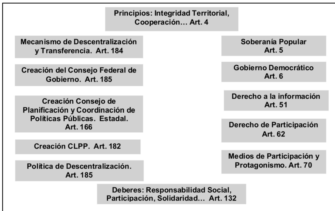
Figura No. 1. Preceptos constitucionales básicos de sustento de la participación