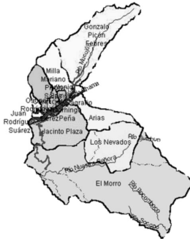
Figura No. 4. Municipio Libertador del Estado Mérida-Venezuela